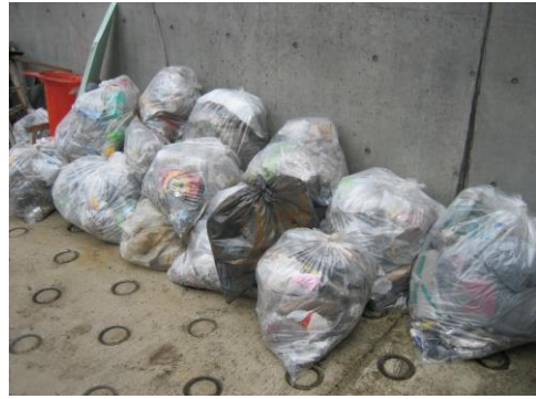
平成 19 年 3 月 29 日 (木) 収集したゴミ