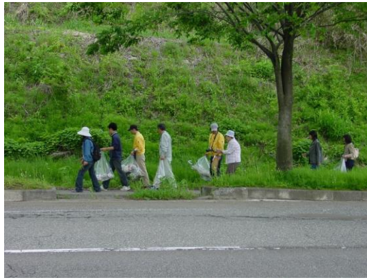
平成 18 年 5 月 16 日(火)収集風景