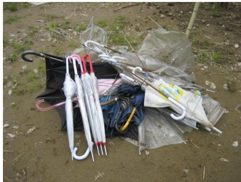
平成 18 年 5 月 16 日(火)収集したゴミ