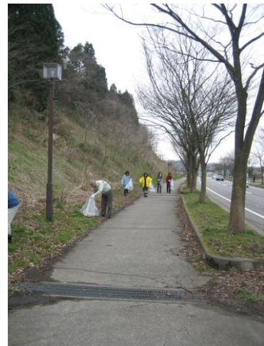
平成 19 年 3 月 29 日(木)収集風景