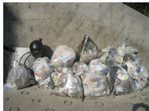
平成 18 年 12 月 22 日(金)収集したゴミ